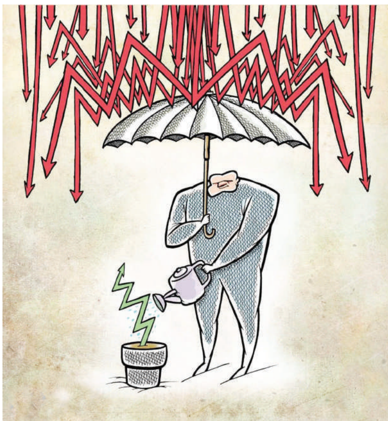
ریزش بورس ادامه دارد