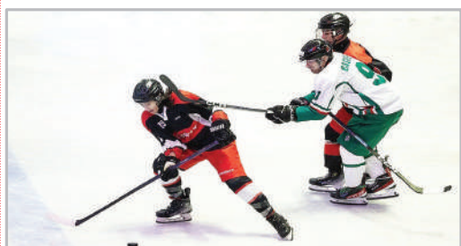
■ دیدار تیم‌های ملی بزرگسالان و جوانان هاکی روی یخ آقایان