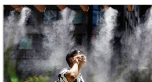
■ آب‌پاش‌های خنک‌کننده - شهر توکیو ژاپن