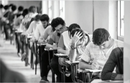
گزارش خبری- ییلا غضنفری

آخرین سفر رئیس‌جمهور شهید آیتا... رئیس‌ی به استان فارس (مهرماه ۱۴۰۲) تلاش شد فعالیت‌ها در این زمینه شتاب بیشتری گیرد. وی ادامه داد: در همین راستا تصمیم گرفته شد که ۱۱۰ هزار قطعه زمین و واحد مسکونی به استان فارس (مهرماه ۱۴۰۲) تعلق یابد و زمین، تخصیص و واگذاری و افتتاح داشته باشیم که در مجموعه‌های مختلف شامل نهضت ملی مسکن، مسکن مهر، اراضی جوانی جمعیت