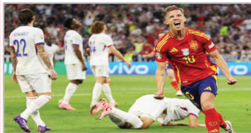
■ راهپایه اسپانیا به مسابقه فوتبال یورو