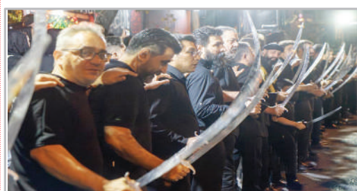
■ مراسم عزاداری «شاه حسین گویان» - تهران